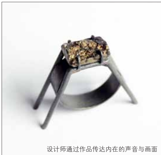
设计师通过作品传达内在的声音与画面