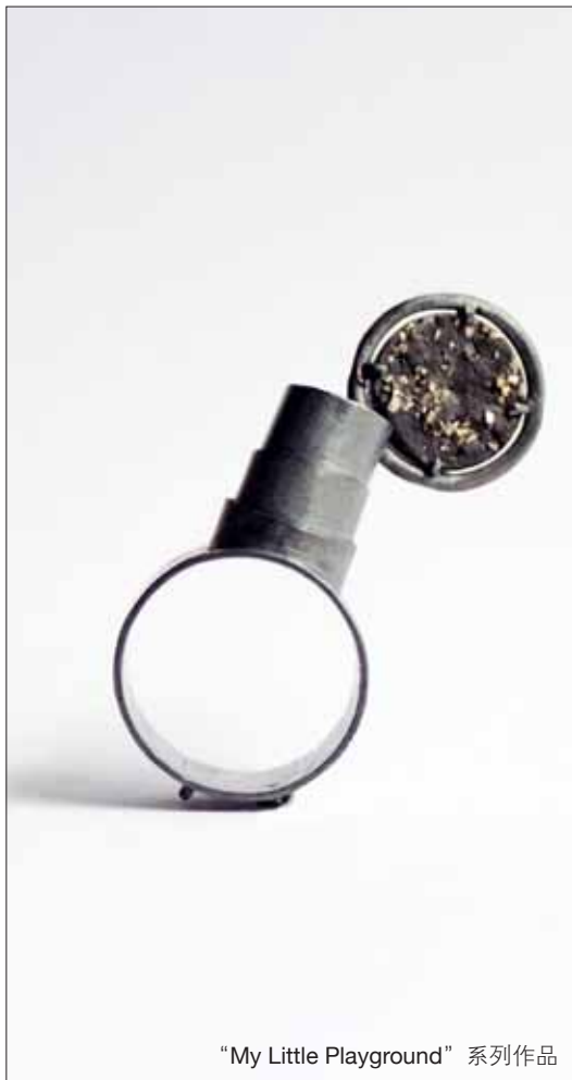
“My Little Playground” 系列作品