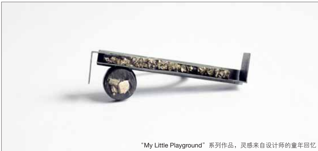
“My Little Playground” 系列作品，灵感来自设计师的童年回忆

开始系统学习，欧洲的金工思维与艺术让她备受鼓舞，同时也让自己对珠宝设计有了新的理解，饰品中自带的个性以及欧洲工艺的手作温度给予了张薇萱诸多热情，因此她在今年成立了自己的设计品牌“miu”，希望能够在诠释出自己珠宝风格的同时，也能传递出珠宝不是简单地以宝石、贵金属成分的多寡就能衡量出价值的观点，她更希望让饰品成为使用者个性的承载和表达。