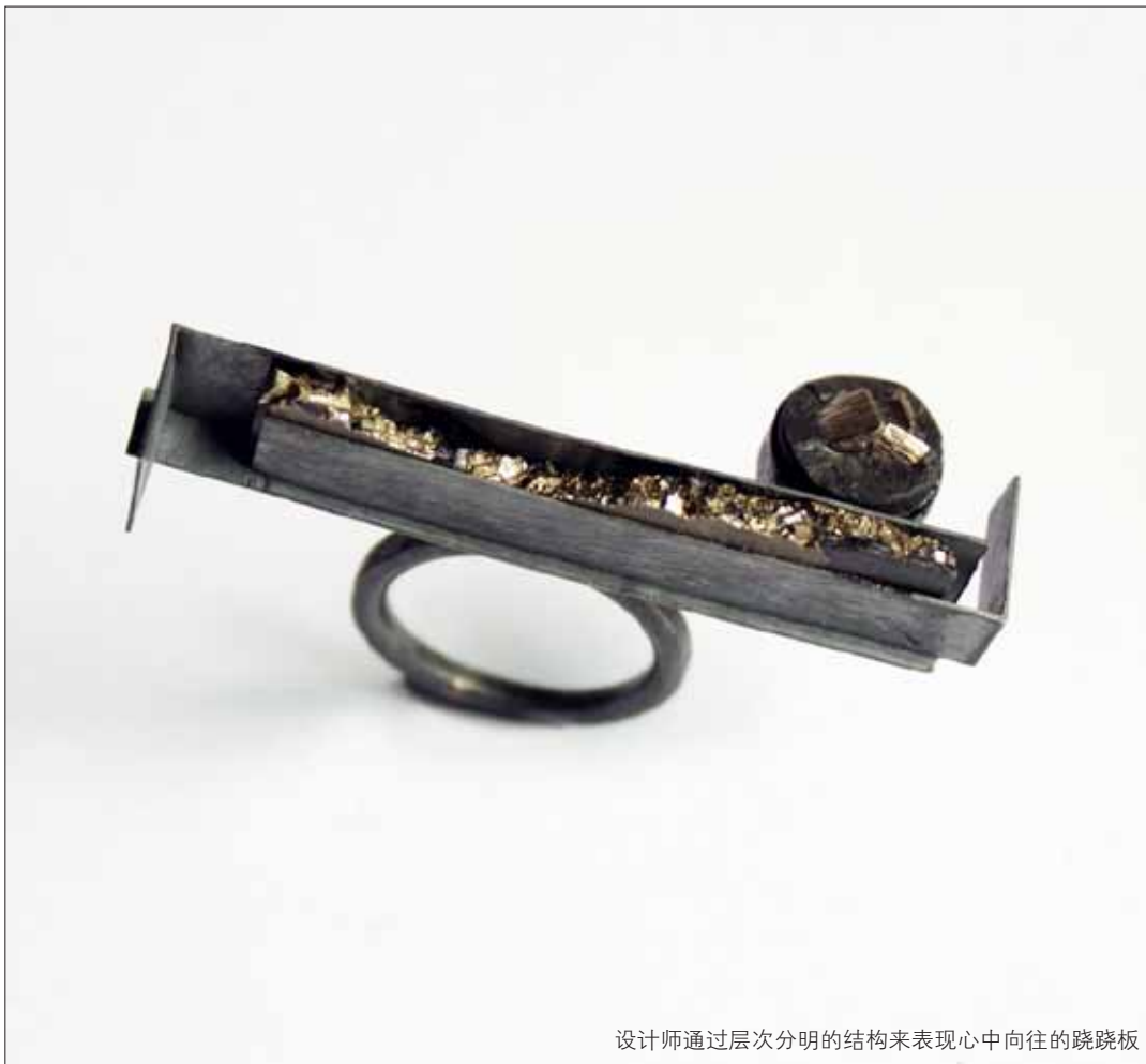
设计师通过层次分明的结构来表现心中向往的跷跷板