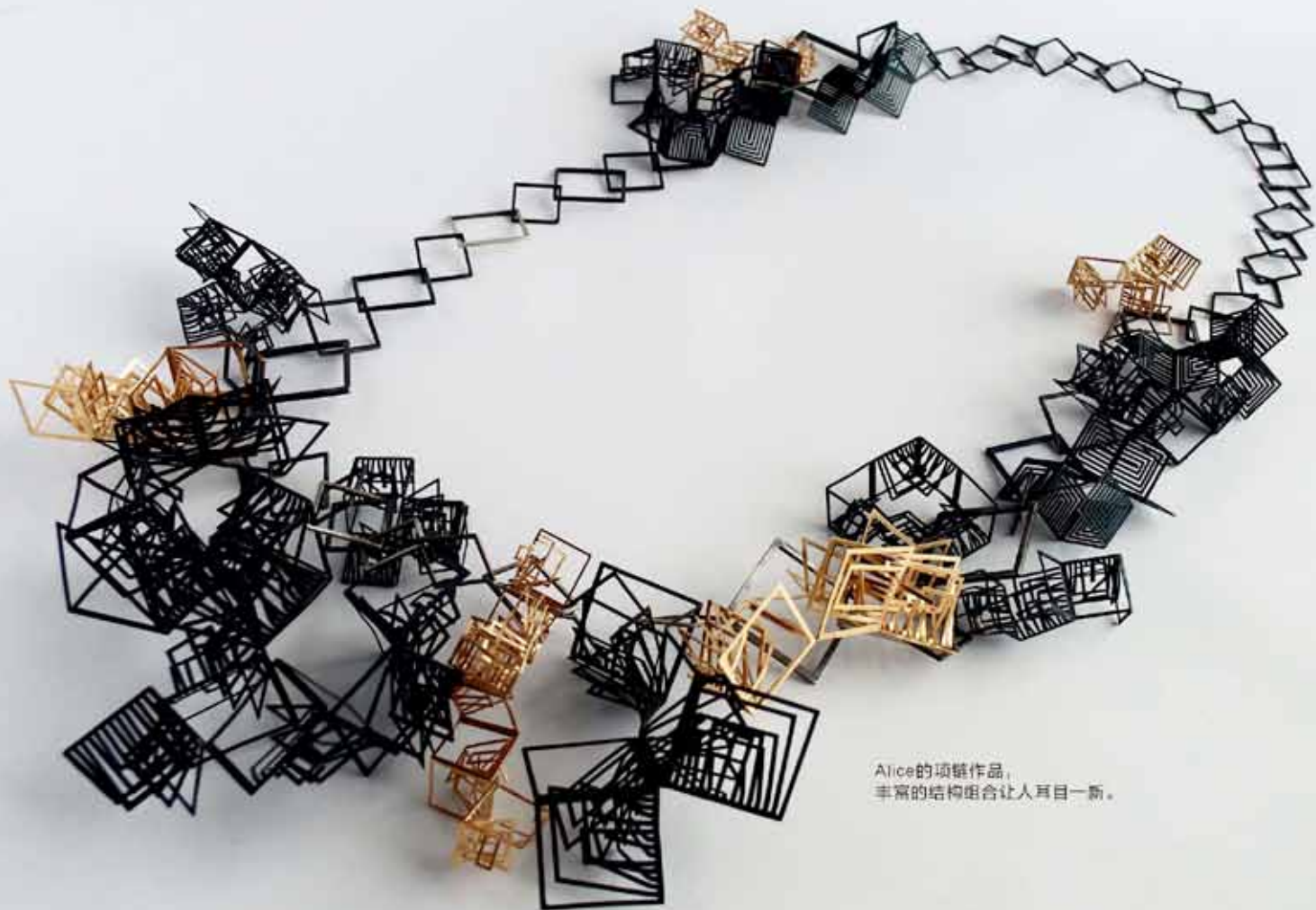
Alice的项链作品，丰富的结构组合让人耳目一新。

灵感来源 ：因为我的建筑背景，我的创作灵感常常来自建筑，无论是现代的还是传统的。 材料的选择 ：根据设计想法和理念，选择不同材料来试验，有时也由客户指定。 首饰的价值 ：设计想法以及理念。