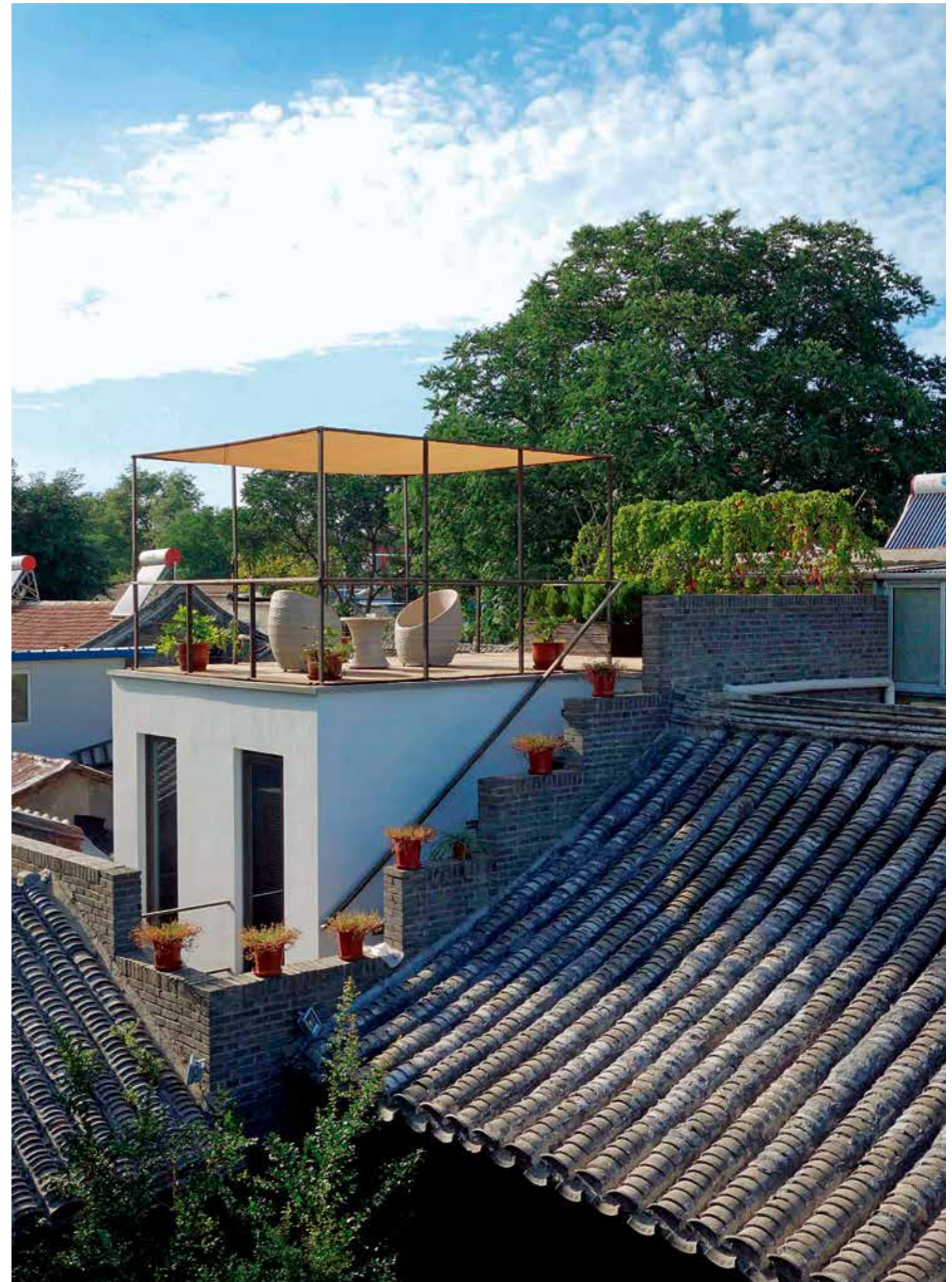
> “老树开新花”北京宝钞胡同的精品酒店The Orchid Hotel改造项目 / 大栅栏排子胡同38号

试图将目光落在生活在大栅栏这片约1.3平方公里区域里的人身上，或许是大栅栏都市更新计划最为引人注目之处。“都更”的最终目标就是改善所有人的生活质量，从这个意义上说，它绝不仅仅只是建筑、规划这么单向度的事。都市更新更像是一场教育与被教育、启蒙与被启蒙的社会运动，必须将公部门、私人机构、NGO、社区住民、志愿者等各种社会力量、各路诸侯聚集整合在一起，才能形成一个长期、持续的循环过程。对于都更来说，没有一蹴而就或永恒的解决方案，往往因时因地而变，大栅栏更新计划其实是对过去三十年暴风骤雨般的疯狂城市化运动中“推土机政策”的反动。它尝试用一种缓慢而